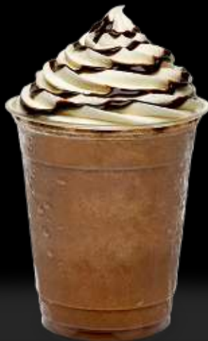
Salsas DaVinci Gourmet