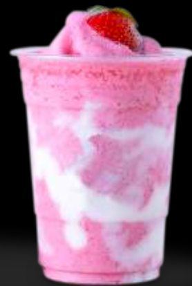
Jarabes DaVinci Gourmet

¡Síguenos en nuestras redes sociales para más ideas de recetas!