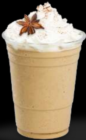
Concentrados Oregon Chai

Frappease Sin Azúcar ayuda a aportar cuerpo y textura a tus bebidas. Mézclalo con productos de la familia Kerry para hacer bebidas deliciosas y sin azúcar .