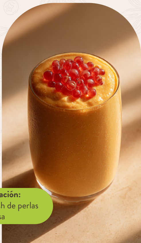
Decoración: Garnish de perlas de fresa