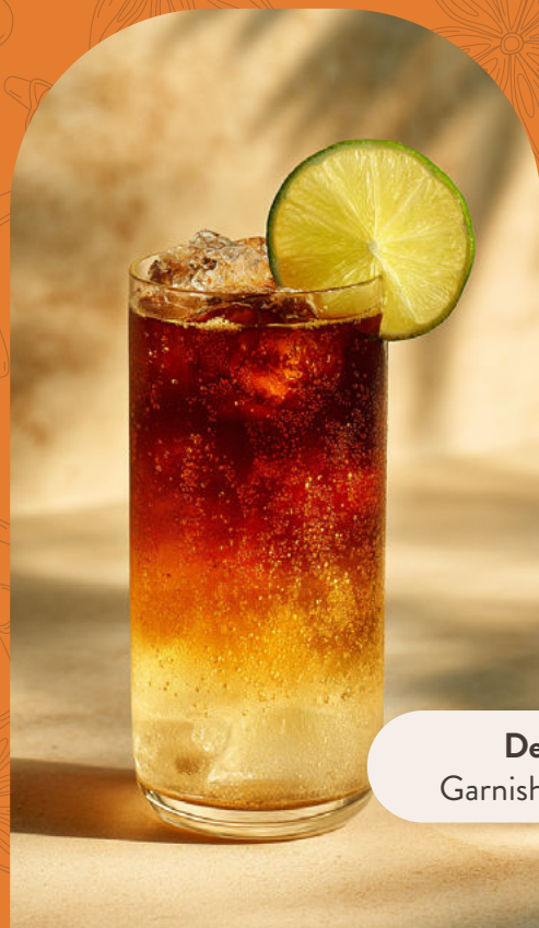
Decoración: Garnish de limón